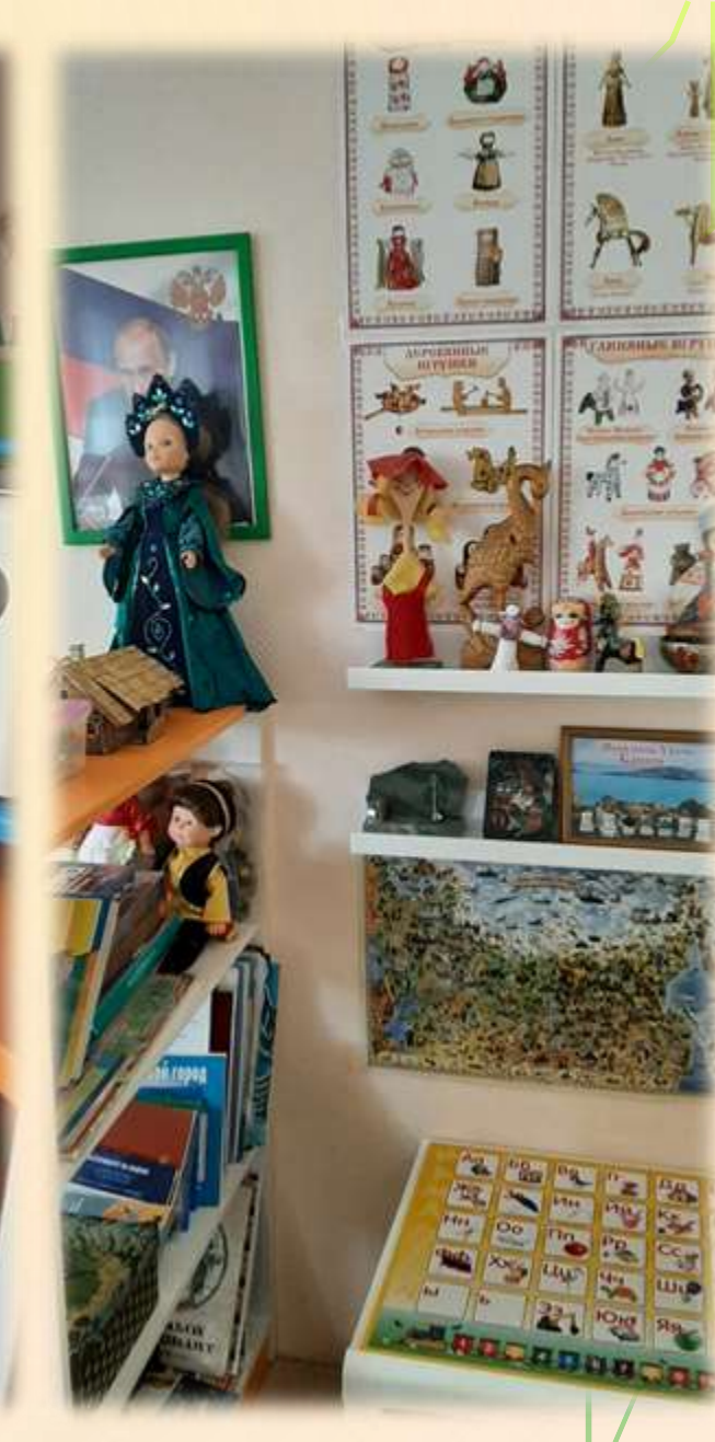
Все пространство в группе зонировано. В каждой зоне находится свой центр активности