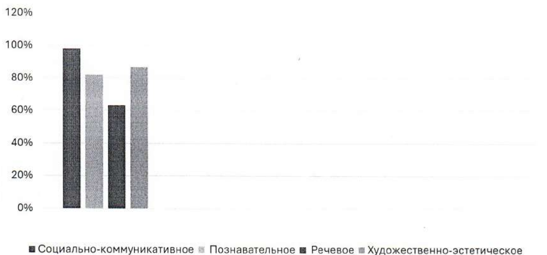
Мониторинг образовательной деятельности за 2025-2026 учеб.год.

В группах дошкольного возраста (3-7(8) лет) Программа «Юные краеведы» дополняет содержание образовательной области «Познавательное развитие».